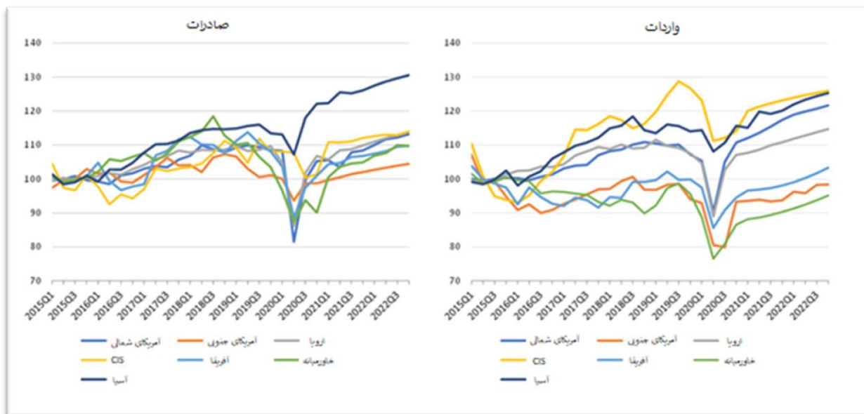
نمودار 1: صادرات و واردات کالا بر اساس مناطق؛ 2015 تا 2022 (پیش‌بینی)

نمودار ذیل شاخص صادرات و واردات فصلی کالاها را در مناطق مختلف برای سال‌های 2015 تا 2020 به علاوه پیش‌بینی سال‌های 2021 و 2022 نشان می‌دهد. در سه ماهه دوم سال 2020، آمریکای شمالی و اروپا با کاهش چشمگیر سالانه حجم صادرات روبرو شدند که به ترتیب 25.8 و 20.4 درصد کاهش داشتند. در سه ماهه چهارم، این مناطق بسیاری از حوزه‌های از دست رفته خود را با افت سالانه تنها 3 و 2.4 درصد بازیافتند. صادرات خاورمیانه نیز در سه ماهه دوم به دلیل کاهش مصرف نفت در سراسر جهان و محدودیت در سفرهای بین‌المللی و داخلی، به شدت سقوط کرد. صادرات آسیا در سه ماهه دوم با کاهشی کمتر 7.2 درصد روبرو شد، اما در سه ماهه چهارم نسبت به سال قبل 7.7 درصد رشد داشت. بهبود سریع این منطقه به واسطه این واقعیت که این کشورها در طی همه‌گیری، کالاهای مصرفی و تجهیزات پزشکی جهان را تامین می‌کنند و مجموع صادرات منطقه را افزایش می‌دهد قابل توضیح می‌باشد.