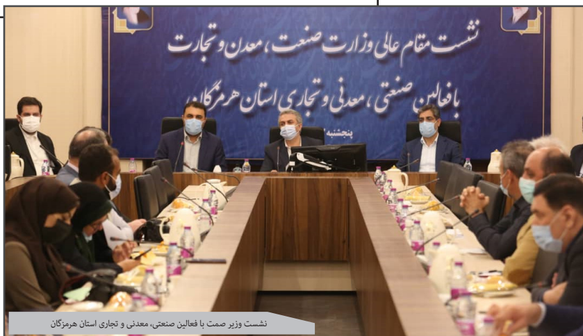
نشست وزیر صمت با فعالین صنعتی، معدنی و تجاری استان هرمزگان