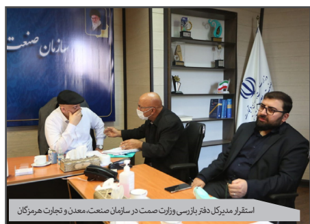
استقرار مدیرکل دفتر بازرسی وزارت صمت در سازمان صنعت، معدن و تجارت هرمزگان