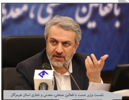
نشست وزیر صمت با فعالین صنعتی، معدنی و تجاری استان هرمزگان