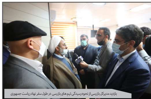
بازدید مدیرکل بازرسی از نحوه رسیدگی تیم های بازرسی در طول سفر نهاد ریاست جمهوری