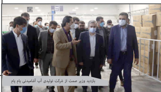
بازدید وزیر صمت از شرکت تولیدی آب آشامیدنی بام یام