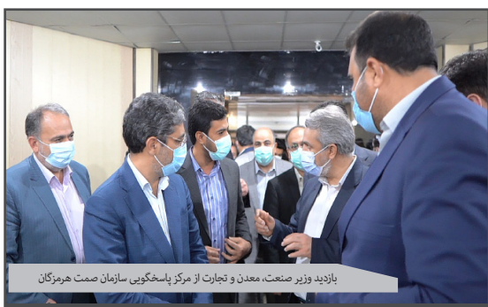
بازدید وزیر صنعت، معدن و تجارت از مرکز پاشخوئی سازمان صمت هرمزگان