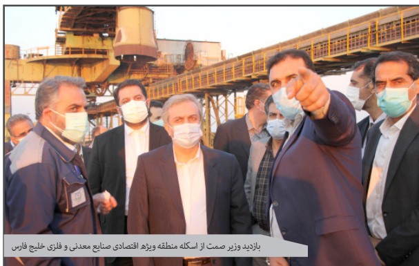
بازدید وزیر صمت از اسکله منطقه ویژه اقتصادی صنایع معدنی و فلزی خلیج فارس