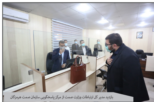
بازدید مدیر کل ارتباطات و وزارت صمت از مرکز پاشخوئی سازمان صمت هرمزگان